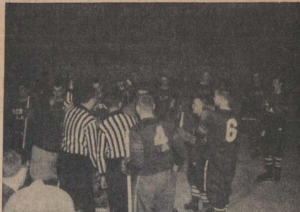
La discussion qui eut lieu à la fin de la joute entre le Derby Club et le Club Musical, n'aura peut-être pas de fin avant longtemps. Les membres du Club vainqueur sont convaincus que le point en question a été enregistré, et les membres du Club Musical sont aussi certains que la rondelle n'a pas pénétré les filets.