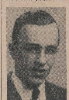
M. St-Pierre qui sert actuellement

Le Sénateur Léo St-Pierre, de Lewiston, a annoncé mercredi soir 24 mars, qu'il serait candidat pour la nomination démocrate au poste de commissaire du comté Androscoggin aux primaires de juin.