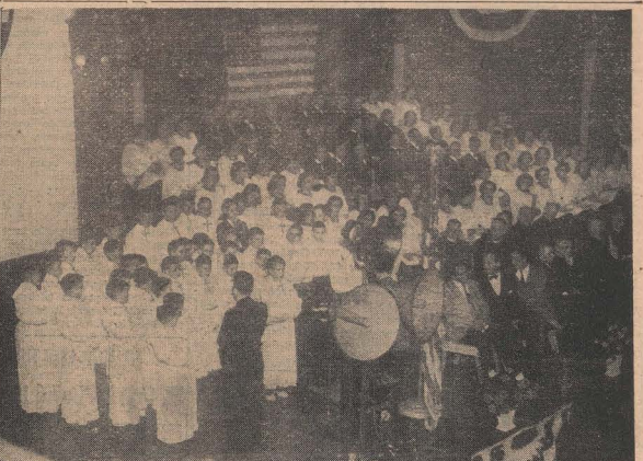
CEUX QU'IL AIMAIT TANT — On voit ici le groupe des PETITS CHANTEURS à la Croix de Bois, en frais de se faire entendre dans quelques pièces de leur répertoire, au manège, hier soir, sous la direction du Frère Raymondien. On aperçoit également sur la scène, les membres de la chorale Saint-Paul. Au premier plan les principaux invités et orateurs