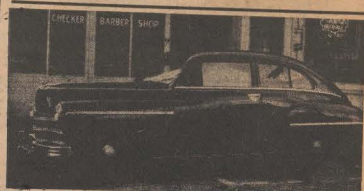
1949 PLYMOUTH 2 portes $795