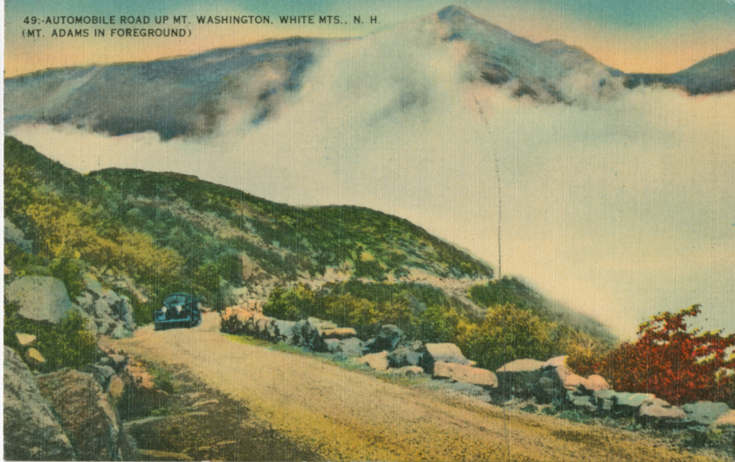
49:-AUTOMOBILE ROAD UP MT. WASHINGTON, WHITE MTS., N. H. (MT. ADAMS IN FOREGROUND)