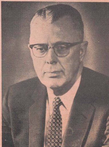
LE SÉNATEUR NORRIS COTTON

Dans un communiqué qu'il nous adresse, le sénateur Norris Cotton annonce qu'il sera de nouveau candidat au poste de sénateur des États-Unis pour représenter le New Hampshire.