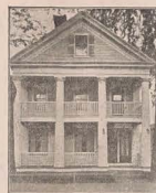
BUREAU CONLEY & POISSON 56 Rue Park