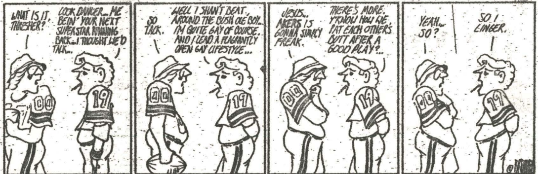
Reprinted from GAY COMMUNITY NEWS;